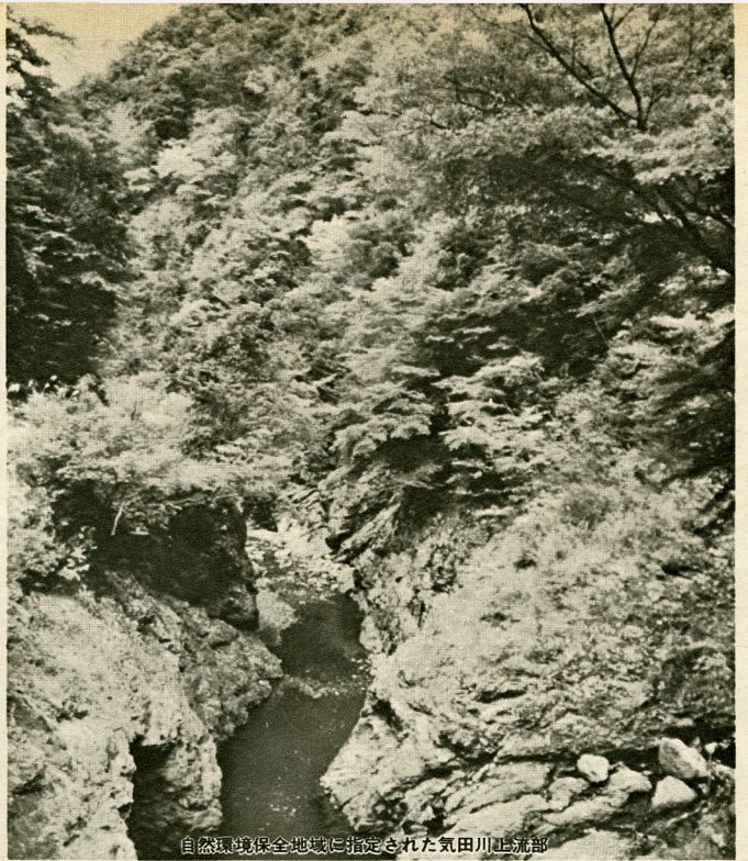
自然環境保全地域に指定された気田川上流部