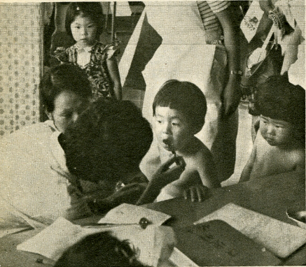
三歳児の健康診査風景

児童手当の引上げは、母子世帯や、父が一年以上も、蒸発しているような世帯に支給されるものです。この手当も、児童一人の場