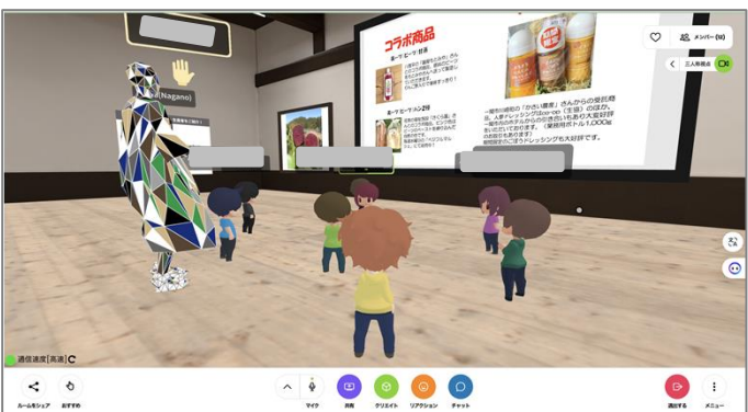
▲ 複数人が集まる様子（食の商談会）