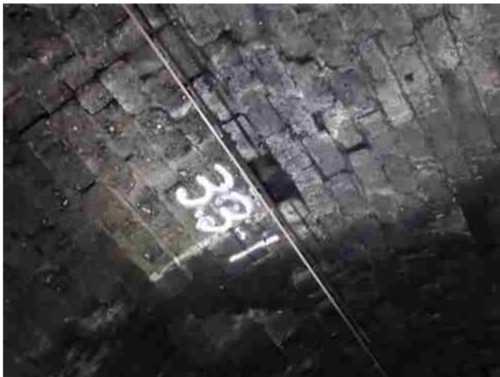
覆工ブロックの抜け