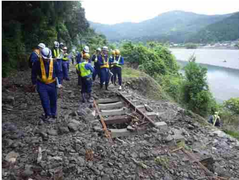
暗渠で排水しきれなくなった水及び土砂により道床が洗掘