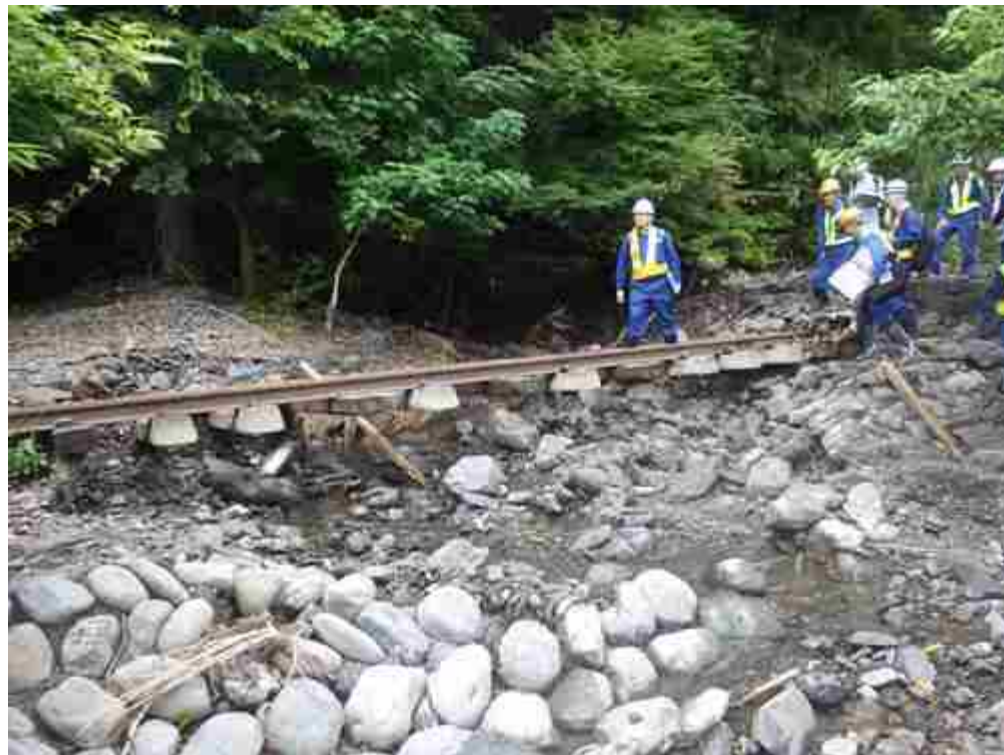
沢の増水により道床が洗掘