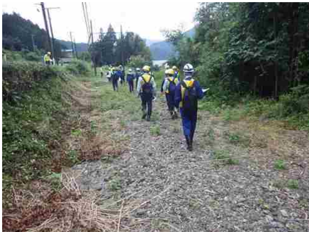
川から溢れた土砂が軌道に流入