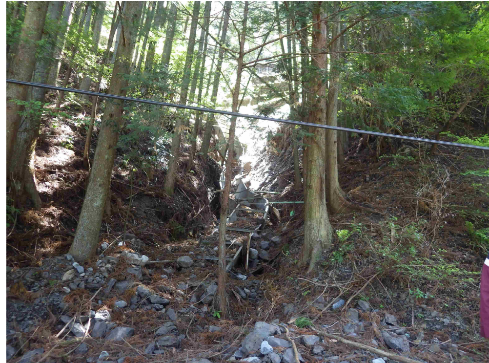
斜面上にコルゲート水路があるが、土砂がたまり、水路周りが洗掘されている