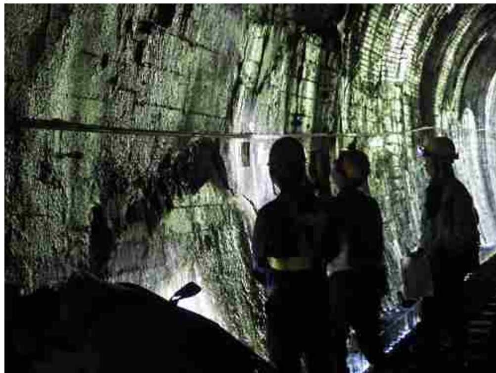
覆工に対する山からの偏圧