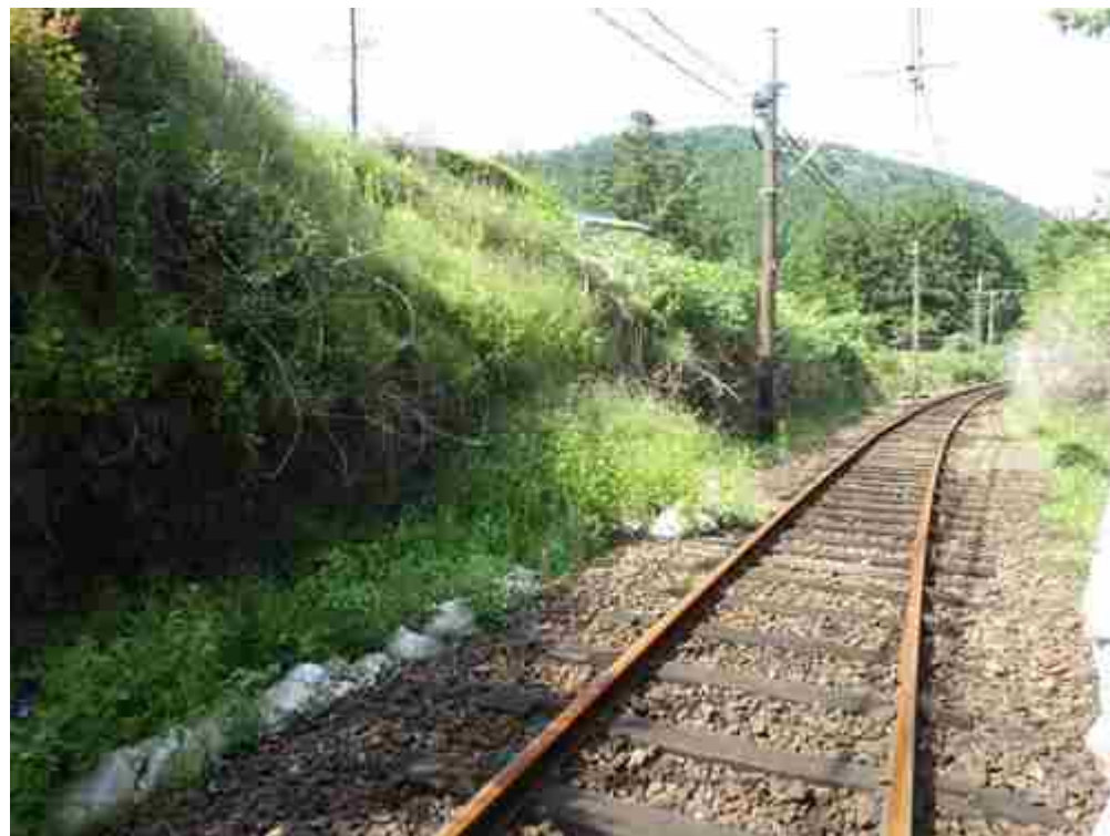
法面表層の土砂流出