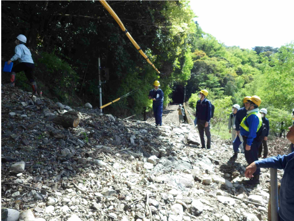
斜面からの土砂が流入している