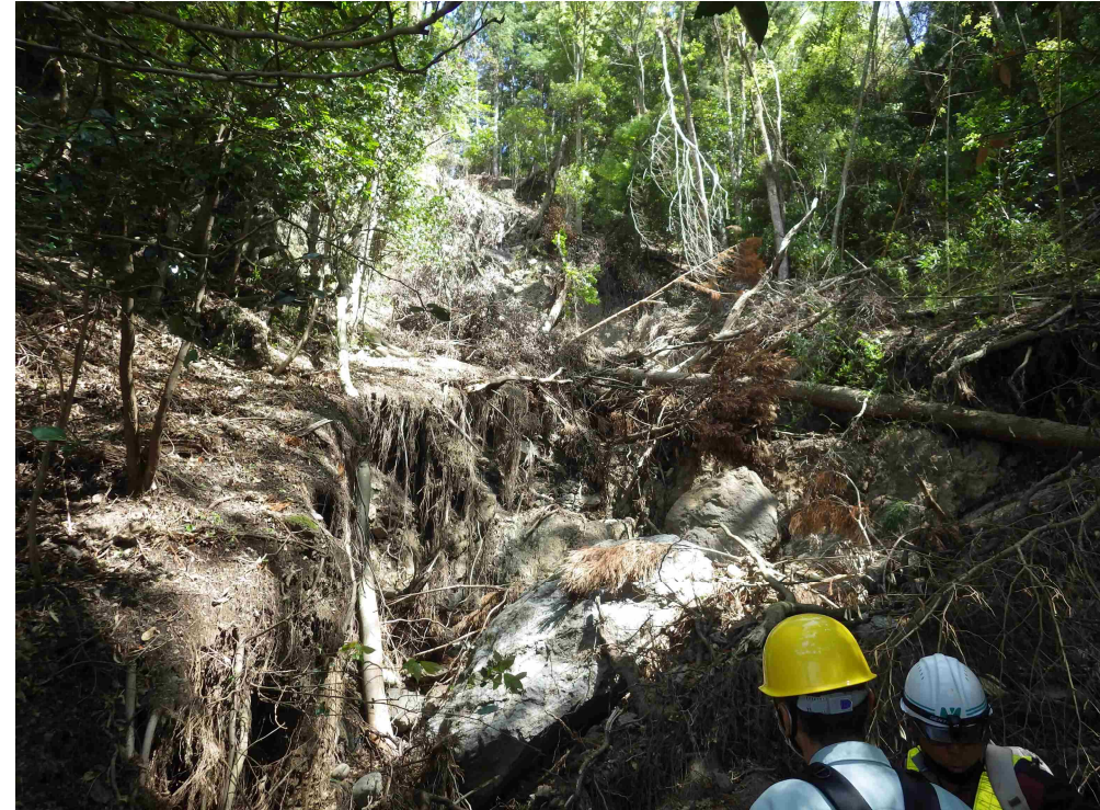
斜面が崩壊し、倒木や巨石が重なっている