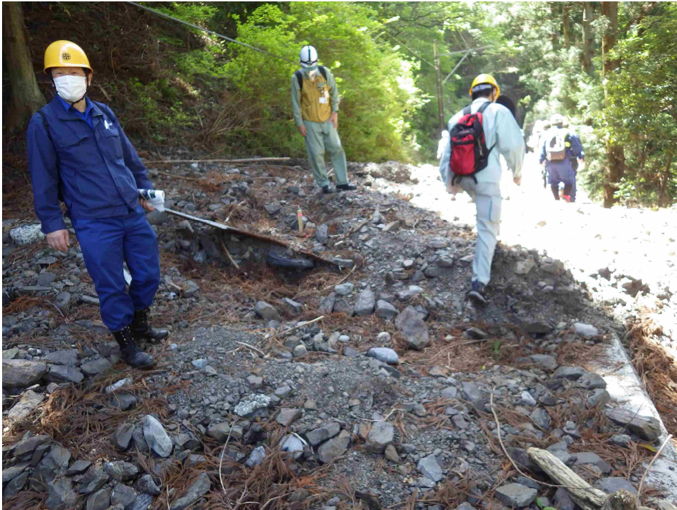
沢から土砂が流入している