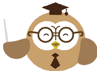
ナビゲーター ホーホー博士(♂) 静岡生まれ。フクロウ。口癖は「ホー」。