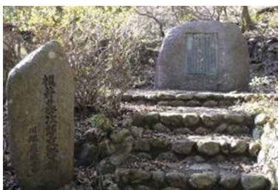
川端が書いた梶井基次郎文学碑(伊豆市)