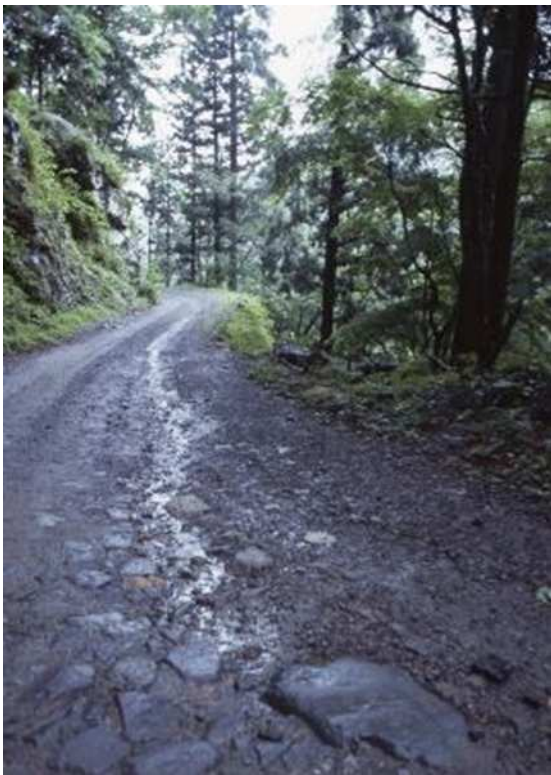
雨上がりの踊子歩道(伊豆市)