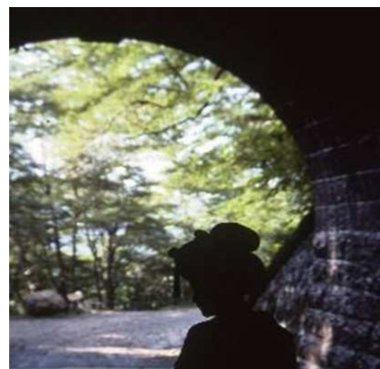
踊子モデルと旧天城トンネル