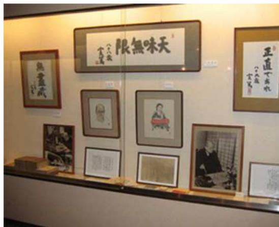
武者小路実篤文学館(いづみ荘 HP から引用)