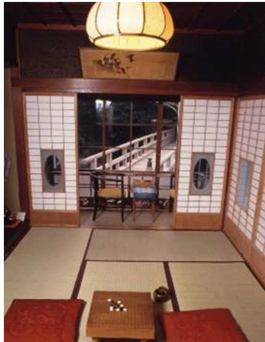
川端が滞在した部屋