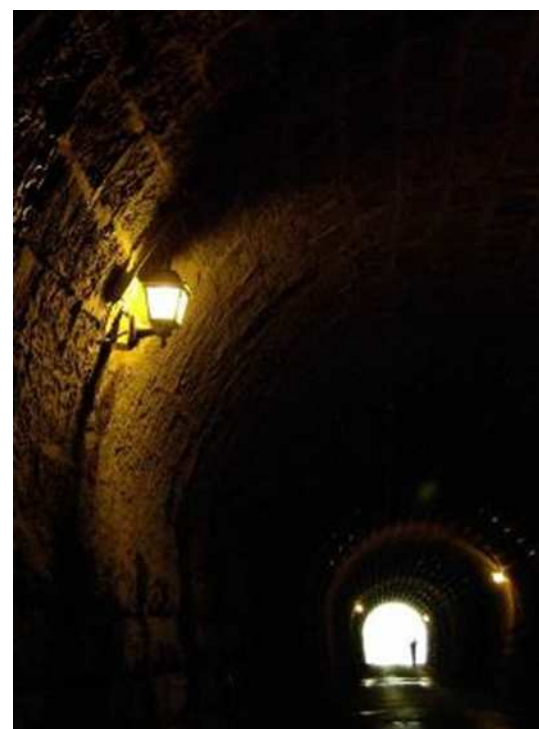
石積みが残る旧天城トンネル内