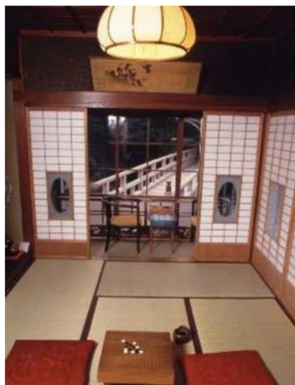
「福田家」川端が滞在した部屋 (河津町)