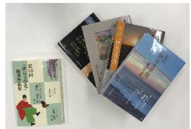
冊子になった伊豆文学賞受賞作品

承と創造による地域づくりに取り組んでいる。さらに、静岡県では、『伊豆文学賞』を設け、県の風土や地名、行事、人物、歴史などを題材にした文学作品を募集し、入賞作の表彰式を伊豆を含めた県東部で開催するなど、新たな文学や人材の発掘を行っている。伊豆の旅館・温泉から新たな作品を生み出し、新たな文豪として名を連ねるのは、伊豆を訪れたあなたかも。