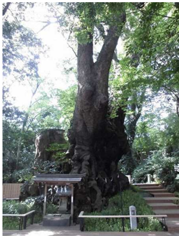
㉑ 阿豆佐和気神社大クス(来宮神社大クス)