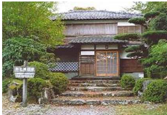
昭和の森へ移築された井上靖旧居