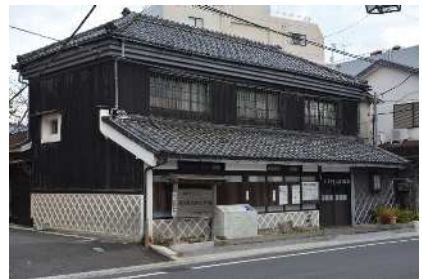
木下杢太郎記念館（伊東市）