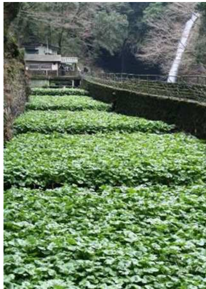
浄蓮の滝とわさび田（伊豆市）