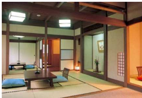
実篤の間(いづみ荘 HP から引用)