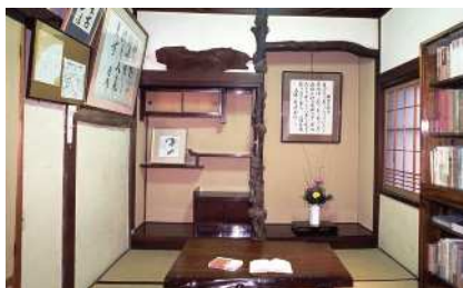
「湯本館」川端が滞在した部屋 (伊豆市)