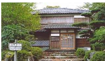
井上靖旧居(伊豆市)

徒歩や馬車で往来していた街道も、大正5年（1916年）にはバスが運行し、地域はさらに活気づいた。踊り子一行が歩いたのは、この頃である。当時、険しかった道も、現在は、ハイキングコース「踊子歩道」として整備され、スギやブナ等の木々に覆われたつづら折りの歩道沿いには『伊豆の踊子』の文学碑や川端のレリーフをはじめ、文学作品の舞台にもなっている滑沢溪谷があり、浄蓮の滝や河津七滝、二階滝、平滑の滝を始めとする大小さまざまな滝、谷間のわさび田等、踊り子一行が歩いた頃と変わらない風景が残る。滑沢溪谷に聳える、天城の太郎杉は、天城の森の恵みを象徴する山中最大の巨木である。