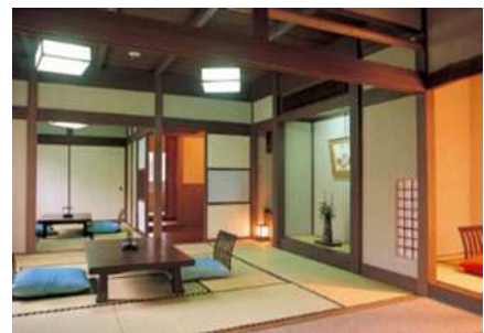
いづみ荘実篤の間（伊豆の国市） （いづみ荘 HP から引用）

大正7年（1918年）の秋、傷ついた心と体を癒すため、一人旅で伊豆を訪れた19歳の学生川端康成。この頃、東京から比較的近い温泉地である伊豆は、東海道線や全国初の道路隧道として天城トンネル（天城山隧道）が開通し、「天城越え」をする下田街道（三島市～下田市へ至る街道）ルートは多くの人々が往来し賑わいを見せた。このような時代背景の中、学生川端は、伊豆の旅で踊り子一行に出会い、川端を代表する文学作品のひとつである『伊豆の踊子』が誕生した。