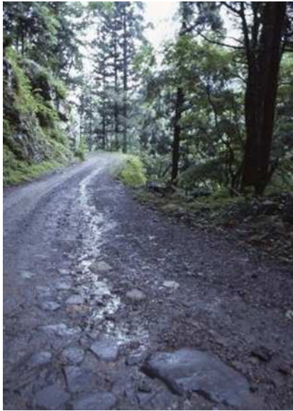
雨上がりの踊子歩道（伊豆市）