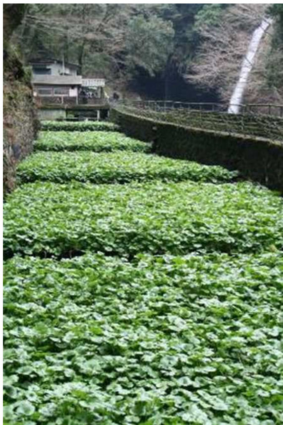
浄蓮の滝とわさび田