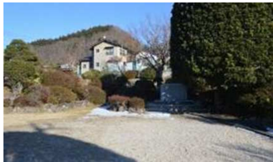
公園整備された井上靖旧邸跡