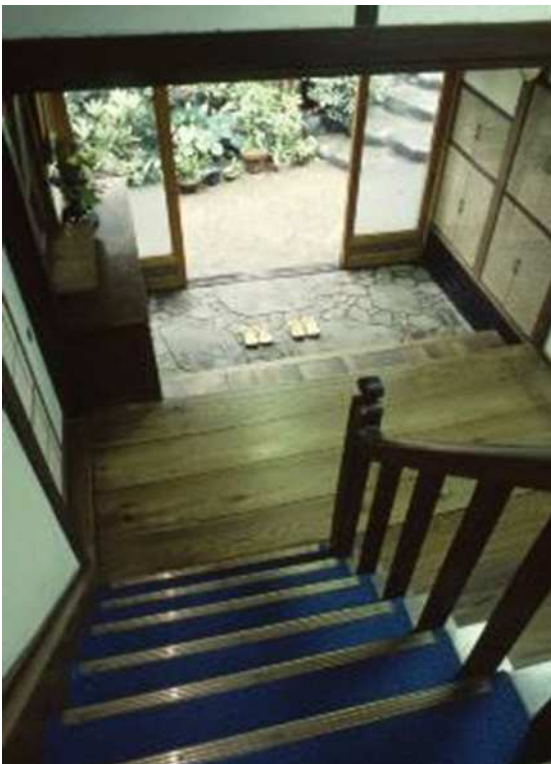
川端が座って踊子を眺めた階段