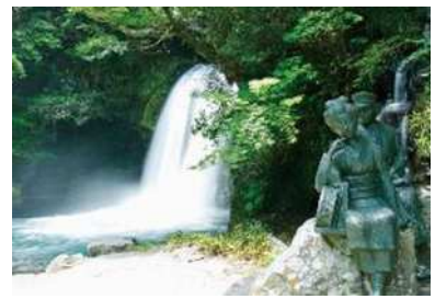
七滝の初景滝と踊子像（河津町）