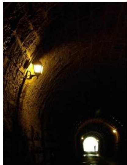
旧天城トンネル (伊豆市・河津町)