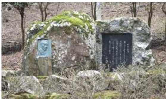
踊子歩道沿いの川端康成文学碑(伊豆市)