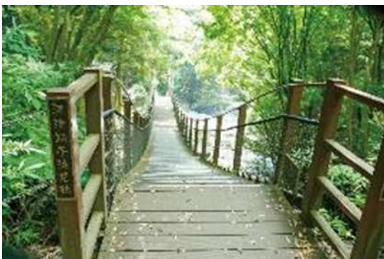
整備された踊子歩道(河津町)