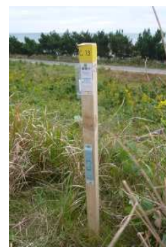
発生調査 (粘着トラップ)