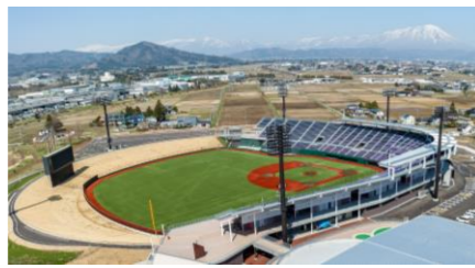
いわて盛岡ボールパーク