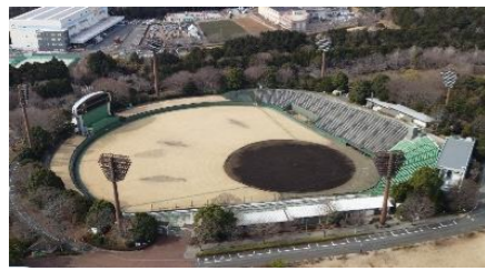
静岡県営愛鷹球場