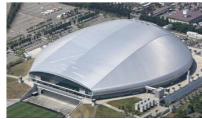
札幌ドーム