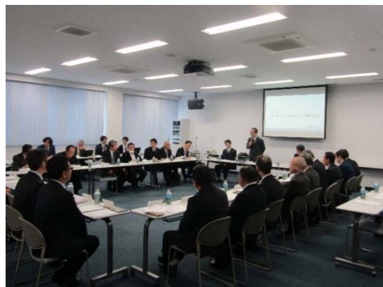
戦略的なまちづくりの議論がスタート

今後は、駅前広場などの「公共空間の再編」及び鉄道跡地などを活用した「新たな都市機能の導入」について、それぞれテーマごとの検討を進めていきます。