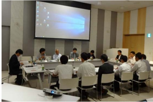
様々な視点から中心市街地について意見交換

市街化区域内における居住と都市機能を誘導する区域を示す「立地適正化計画」と沼津駅周辺総合整備事業など各種事業と既存ストックの活用・連携を図る「中心市街地まちづくり戦略」について議論を進めていきます。