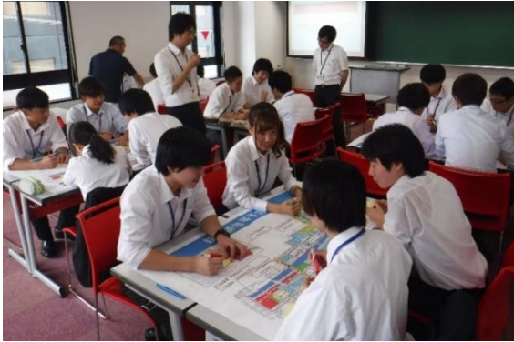
必要な都市機能について意見を出し合う

9月28日(木)に大原公務員医療観光専門学校を訪問し、公務員課の1年生を対象に鉄道高架後のまちづくりについて、グループワークを開催しました。