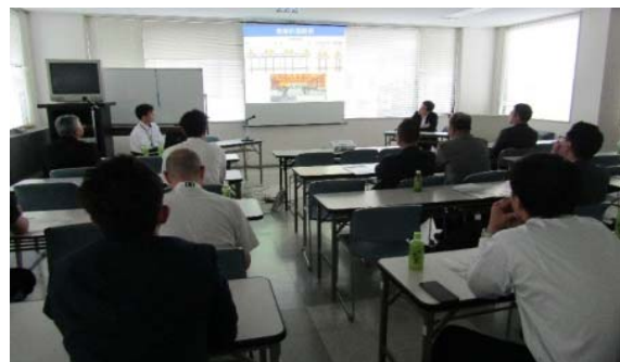
【沼津大手町商店街振興組合】 (平成29年5月26日実施)