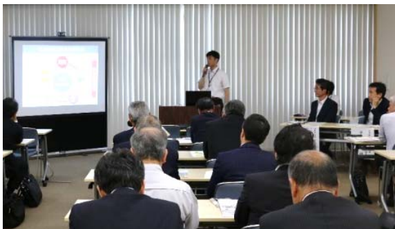
【沼津商工会議所 建設関連部会】 (平成29年5月15日実施)

今後も継続的に実施していきますので、事業説明等ご要望がございましたら、沼津市沼津駅周辺整備部推進課までご連絡をお願いします。