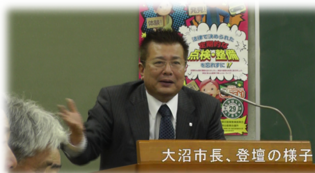
大沼市長、登壇の様子

県と沼津市は、今後も連携を図りながら、鉄道高架事業の工事着手に向けた準備を進めていきます。