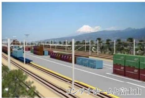
コンテナホームと富士山