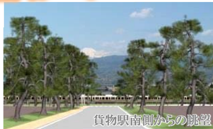
貨物駅南側からの眺望