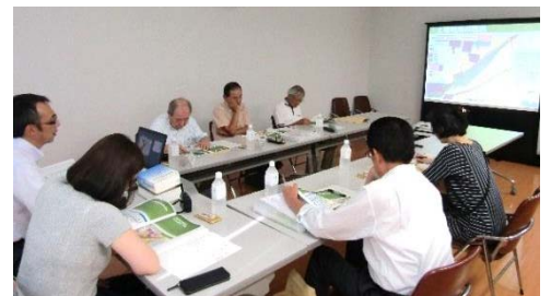
第1回まちづくり協議会の様子

今後、将来のまちのイメージなどを共有しながら、良好な住環境の創出を実現するために必要なルールとなる「地区計画」の素案を今年度中に策定する予定となっています。