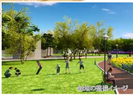
緑地の整備イメージ