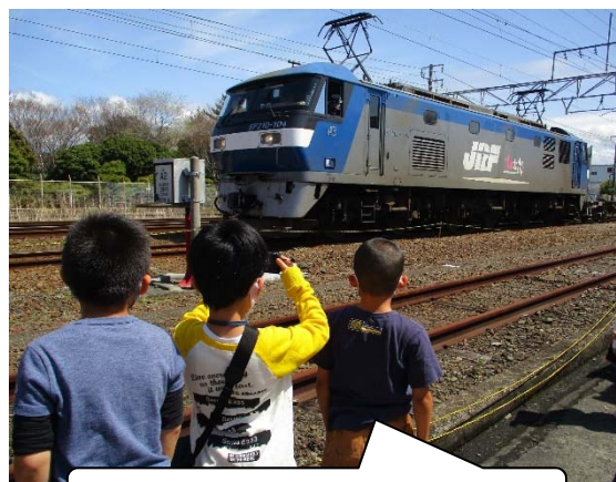
こんなに近くで機関車を見られた！