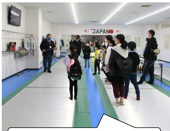
フェンシングの競技台（ピスト）に乗れた！

プラサヴェルデでは、鉄道高架後のイメージ模型やコンベンションホールを見学しました。昨年BiVi沼津にオープンしたフェンシング練習場のF3BASEでは、フェンシングのサーブルやマスクに触る体験をしました。JR貨物沼津駅では、コンテナに入ったり、機関車を間近に見学することができました。参加者からは「機関車を近くで見られて楽しかった」等の声を聞きました。