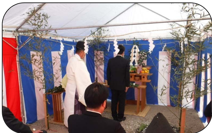
着工式に先立って行われた「地鎮祭」の様子

新貨物ターミナル造成工事・調整池築造工事の着工式を1月14日に開催しました！ 本号では当日の様子(表面)と、今回着工した工事(裏面)についてご紹介します。