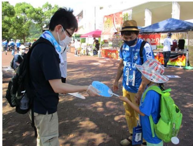
アスルカラーのうちわを配布

例年は、会場内に事業PRブースを設置し、完成イメージの模型やパネルを展示しながら、直接対話による事業説明を行っていますが、今年は、密を避けるために展示や説明は行わず、マスクとビニール手袋を着用してうちわの配布のみを実施しました。