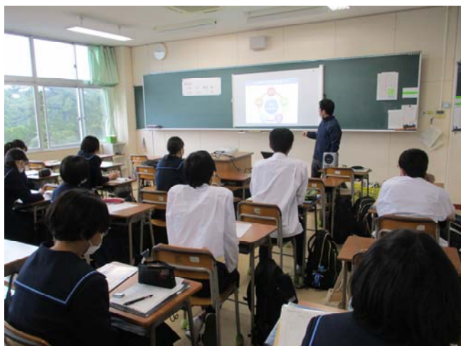
沼津西高での事業説明の様子

10月14日（水）には、大原公務員医療観光専門学校沼津校で公務員科1年生29人に事業説明を行うとともに、鉄道高架後の沼津駅周辺のまちづくりについて考えるグループワークを実施しました。学生から鉄道高架後の沼津駅周辺に欲しい施設として、飲食店や大型の商業娯楽施設、ジムやスポーツ公園などの運動施設等が挙げられました。