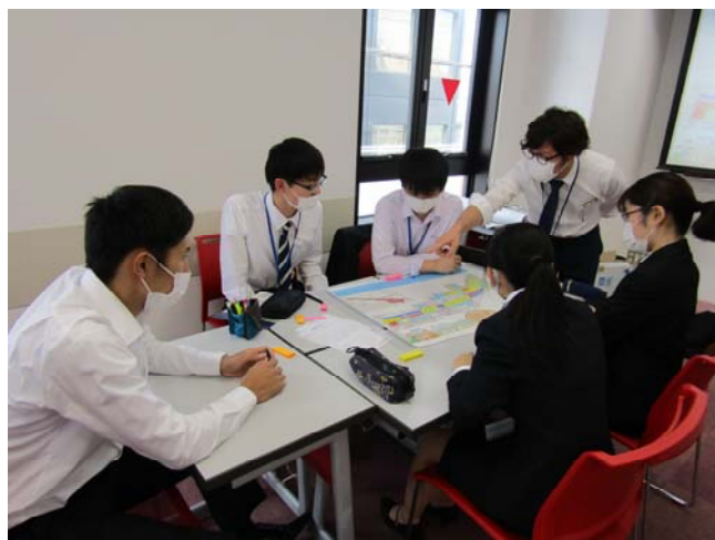
大原専門学校のグループワーク