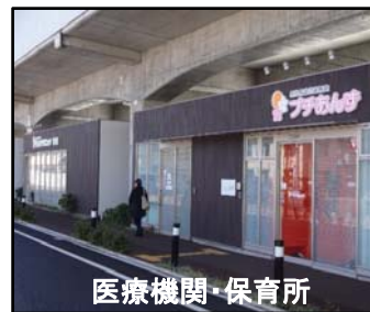
医療機関・保育所