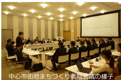
中心市街地まちづくり戦略会議の様子