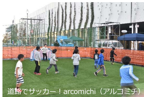
道路でサッカー！ arcomichi（アルコミチ）