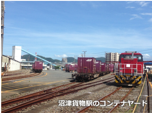
沼津貨物駅のコンテナヤード