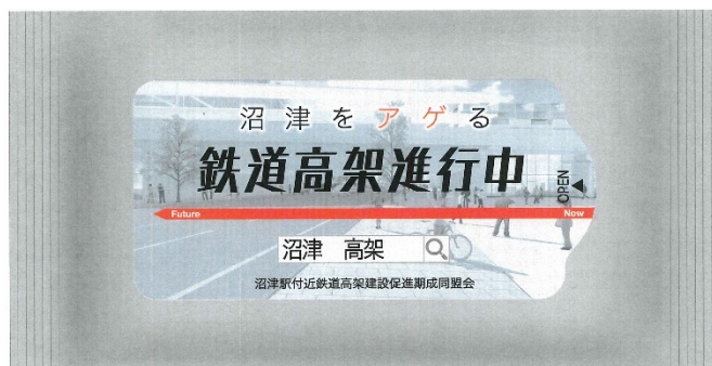
新しくなった事業PR用ウェットティッシュのデザイン