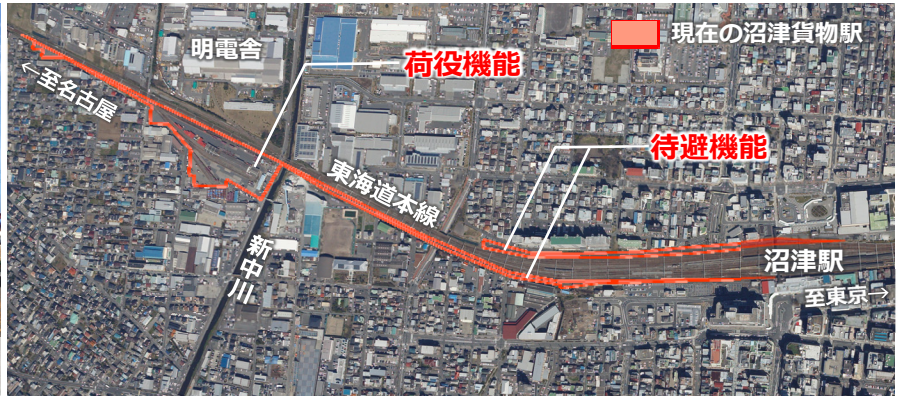
現在の沼津貨物駅