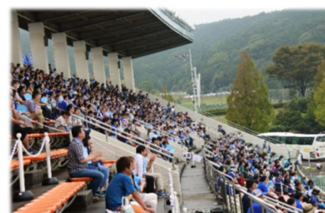
約2500人が試合を観戦 （うちわも応援に一役）