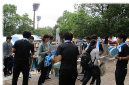
アスルカラーのPR用うちわを配布