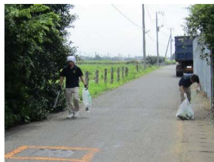
ゴミ拾いの様子 (新貨物ターミナル用地周辺)