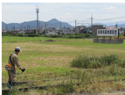
草刈りの様子 (新車両基地用地)

取得した事業用地では、職員などが定期的に草刈りをするなど、しっかりと管理を行い、早期着工の準備を進めてまいります。