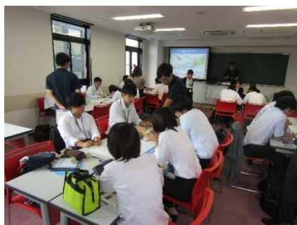
将来のまちの姿を議論