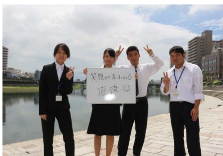
狩野川でメッセージ写真