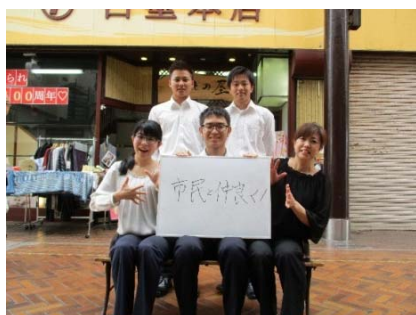
仲見世商店街でメッセージ写真