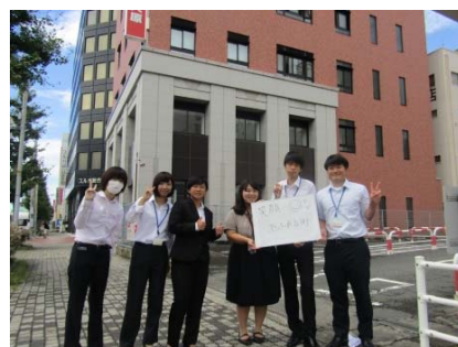
学校前でメッセージ写真