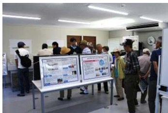
パネルや模型も展示