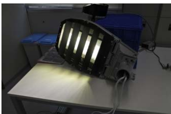
照明器具のサンプル