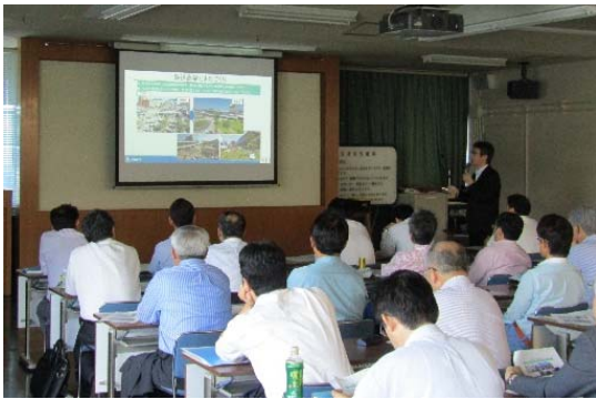
新屋副市長による説明

市は、6月29日（金）に第4回沼津市リノベーションまちづくり推進連絡会議を開催しました。