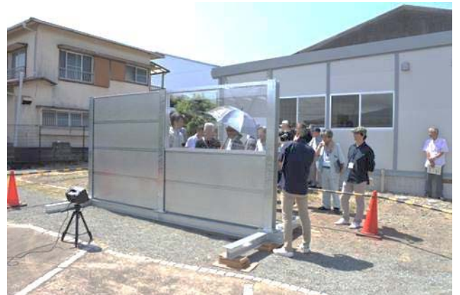
50人以上が来場し、防音壁の効果を実感！