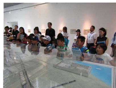
模型の前でまちづくりを勉強

電話での申込となります。(7/10から受付開始) 詳しくは、市推進課まで (055-934-4768)