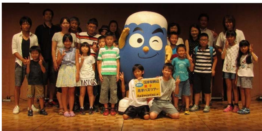
プラサヴェルデでは、「ふじっぴー」がお出迎え！