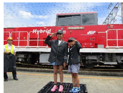
JR貨物の制服を着て記念撮影 写真は、平成29年度の様子です。