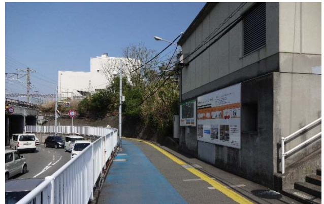
三つ目ガード付近（平成30年4月撮影）

このような三つ目ガードの現況や将来イメージについて写真等を使いながら、紹介しておりますので、歩道を通行される際には、ぜひご覧ください。