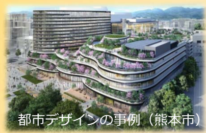
都市デザインの事例（熊本市）

新たに整備される空間について、景観に配慮された高質なヒト中心の都市空間としていくためのデザイン検討が考えられています。