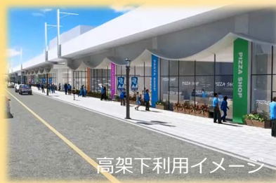
高架下利用イメージ

鉄道高架事業で生まれる広大な鉄道跡地や、高架下の新たなスペースの活用により導入される新たな都市機能※2の具体的な検討が考えられています。