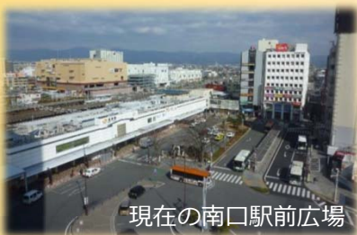
現在の南口駅前広場

沼津市の顔となる南口駅前広場周辺地区においては、既存の公共空間※1を自動車中心からヒト中心の空間への検討が考えられています。