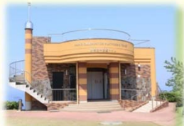
トイレ兼用展望台