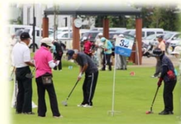
グラウンドゴルフ場