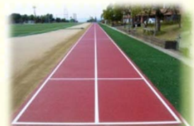
陸上競技練習用走路