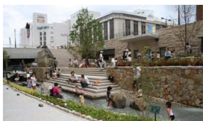
多くの子どもたちでにぎわう交流広場 (キャッスルガーデン)