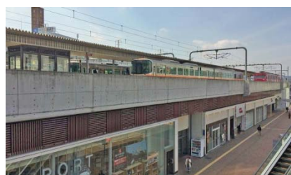
鉄道が高架化された姫路駅付近