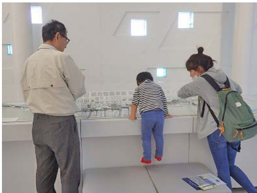
11月10日「ふじさんっこ応援フェスタ」にあわせて開催 子ども連れのお母さんお父さんが多数来場してくれました。

11月10日、15日にプラサヴェルデで沼津駅前まちかどトークを開催しました。両日で総計600人以上の方々にご来場いただきました。