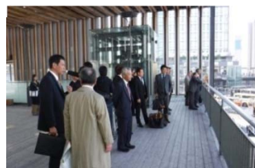
展望デッキで姫路市職員から説明を受けました

姫路市では、鉄道高架とともに駅前広場も整備しています。「専門家会議」・「セミナー」・「ワークショップ」など市民参加により都市デザインが検討され、車両通行を制限した“人が主役の居心地よい”駅前空間として生まれ変わりました。