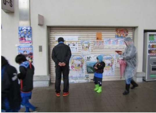
事業の必要性を示すポスターを掲示

今後も、様々な機会を通じ、新しいまちづくりへのご理解をいただけるように事業の周知を図ってまいります。