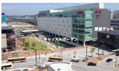
歩行者優先の居心地のよい駅前広場