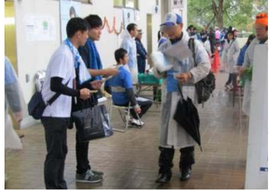
来場者にパンフレット等を配布しました