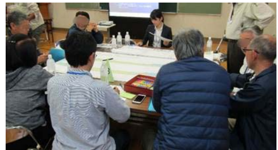
グループごとに様々な提案が出されました

今後もワークショップを開催し、いただいたご意見、ご要望を参考に施設整備の基本設計を検討してまいります。