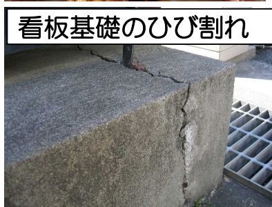
看板基礎のひび割れ