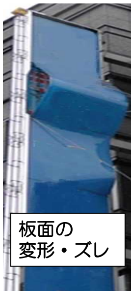
板面の 変形・ズレ