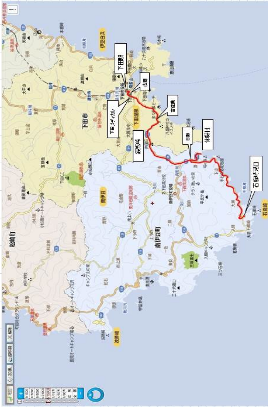
【下田駅～休暇村～石廊崎線 路線図】