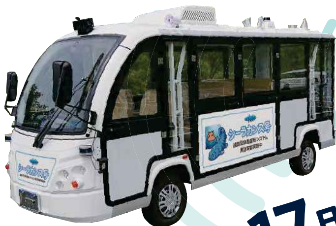
▲シーラカンス号 (EV車両)