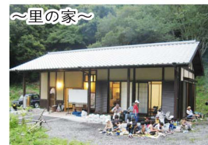
～里の家～ 昔の民家をまねて建てられた「里の家」を休憩所等として使うこともできます。(要予約)