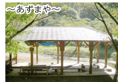
～あずまや～ 休憩や食事のゆったりとれるあずまやが「はらっぱ部」に整備されています。

◎静岡県中部農林事務所 森林整備課 静岡市駿河区有明町2-20 TEL. 054-286-9061