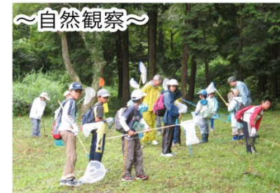
～自然観察～ 春夏秋冬に応じたプログラムが用意され、スタッフが園内を案内します。(要予約)