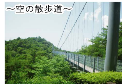
～空の散歩道～ 長さ150mの吊り橋で、アカマツの樹海や天竜川、浜北の町並みが望めます。