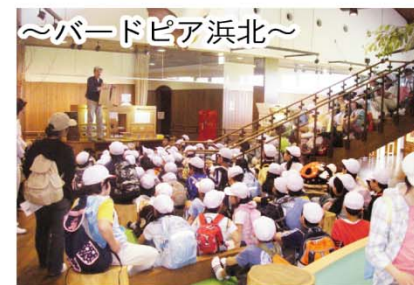
～バードピア浜北～ 鳥類を中心とした自然に関する情報を発信。色々な事が学べます。