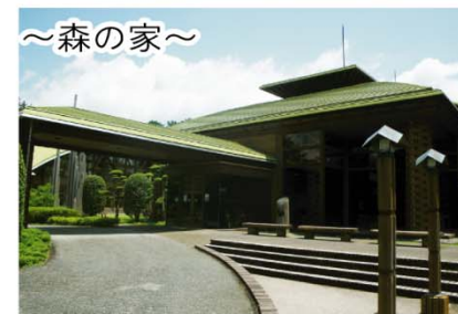
～森の家～ 宿泊・研修やレストランなど様々な用途に利用できる施設です。

◎静岡県西部農林事務所 森林整備課 浜松市中区中央一丁目12-1 TEL. 053-458-7236