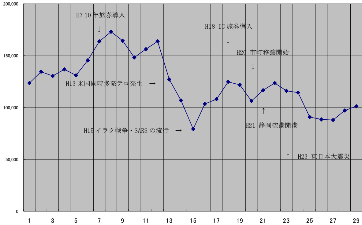
図-3 発行旅券件数の推移（全国）〔暦年〕