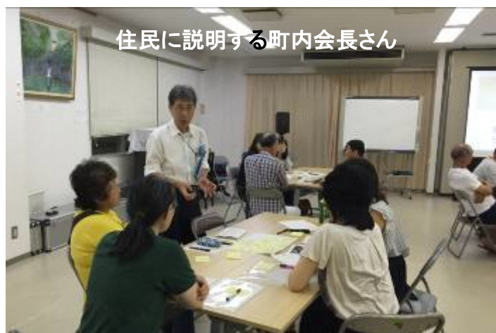
住民に説明する町内会長さん