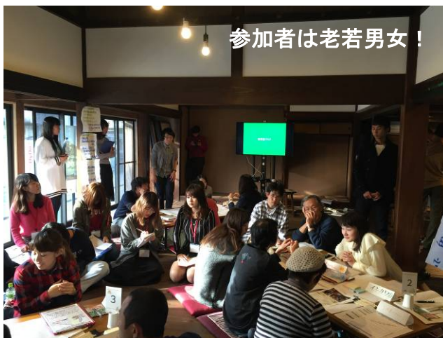
参加者は老若男女！

「子どもの頃に何をして遊んだか」「牛原山で実際にどんなことをしてみたいか」など、グループごとに意見をまとめて共有しました。