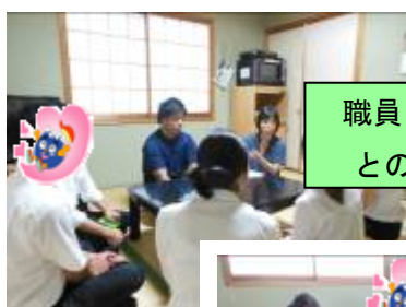
職員（心理職・児童福祉職） とのフリートーク