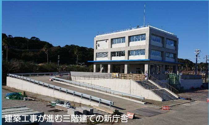
建築工事が進む三階建ての新庁舎