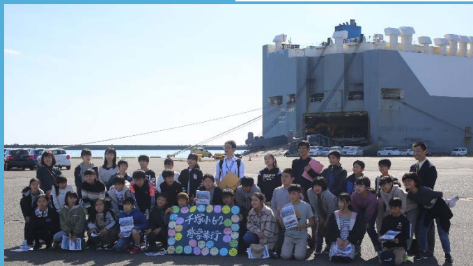
完成自動車を積み込む自動車運搬船

また、11月12日(木)には、同じく甲府市の大里小学校の児童たちも修学旅行で訪れてくれました。