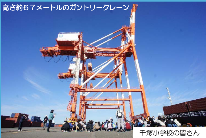
高さ約67メートルのガントリークレーン