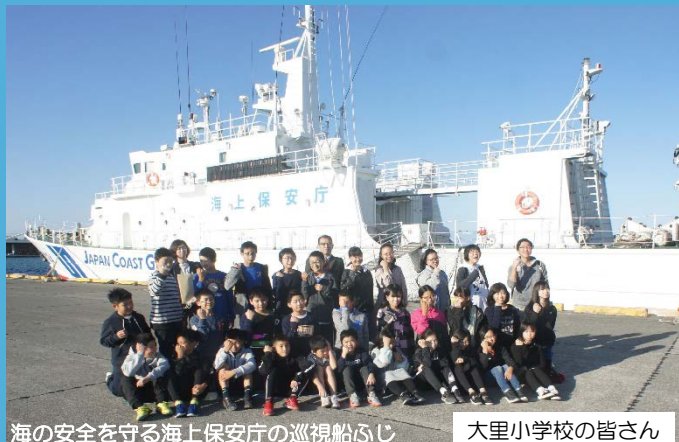
海の安全を守る海上保安庁の巡視船ふじ