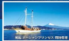
帆船 オceanプリンセス 同時寄港