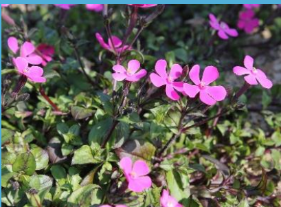
ツルコザクラ (ナデシコ科)

ヨーロッパ原産の宿根草です。ピンクの小さい花が株を覆うように咲きます。これから5月にかけて楽しめます。