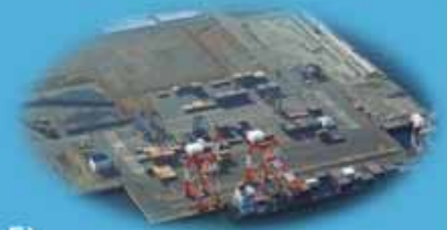
御前崎港コンテナターミナル