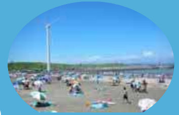
「マリンパーク御前崎」海水浴場