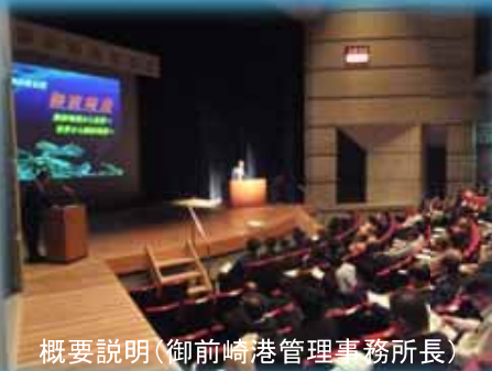
概要説明(御前崎港管理事務所長)