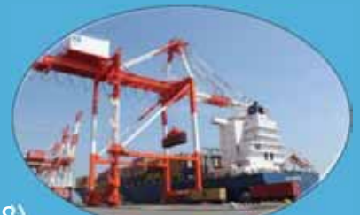
コンテナクレーン1号機