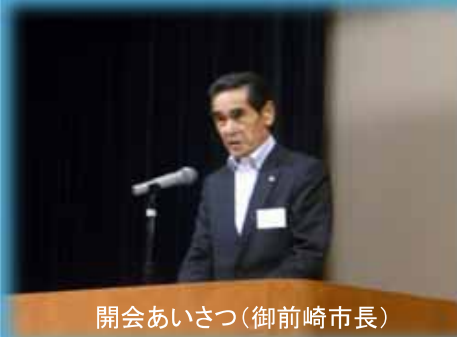
開会あいさつ(御前崎市長)

今年のお秋には「御前崎港セミナー」を開催し、さらなる御前崎港の利用促進に向けた活動を展開してまいります。