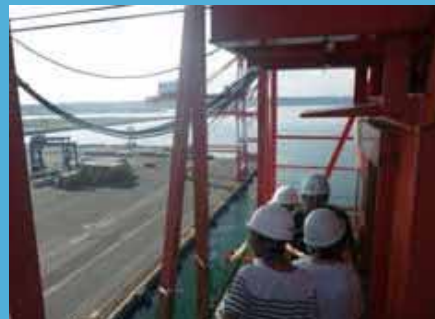
コンテナクレーン操縦席での見学