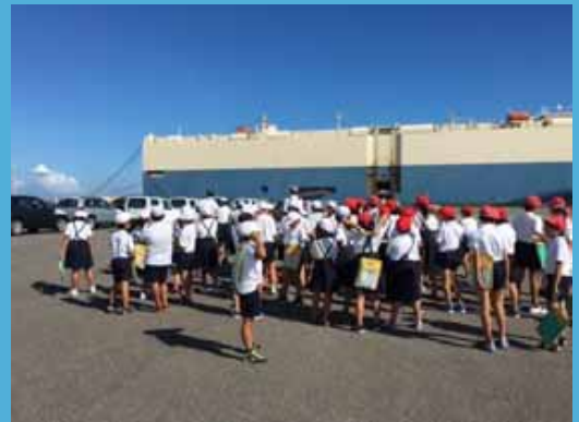
写真は、9月27日静岡市立河原小学校社会見学会の様子

御前崎港の見学を御希望の方は、お気軽に管理事務所まで御連絡ください。皆様のお越しをお待ちしております