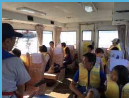
海上から御前崎港の見学