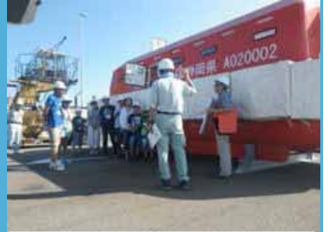
津波救命艇の見学