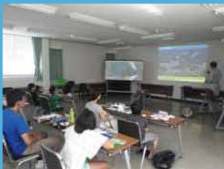
御前崎港の概要説明

見学会では、国土交通省の監督船「ふじ」に乗船し、海上から御前崎港を見学した後、普段は立ち入ることができない国際コンテナターミナルで、実際にコンテナクレーンの操縦席に乗り込み、荷役作業のデモンストレーションを見学しました。