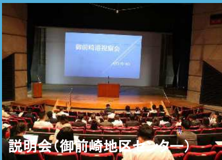
説明会(御前崎地区センター)

牧之原市と御前崎市の市長出席のもと、県中西部地域の荷主企業をはじめ船会社など延べ157名(1回目70名、2回目87名)のご参加を頂き、御前崎港のセールスを行いました。