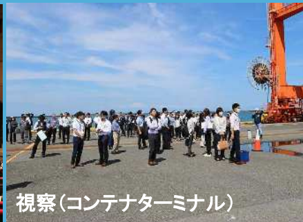
視察(コンテナターミナル)

午前の部では御前崎地区センター大ホールにて、港の概要、当港の主要取扱貨物である定期コンテナや完成自動車の取扱状況、利用にあたっての優遇制度等について説明を行いました。