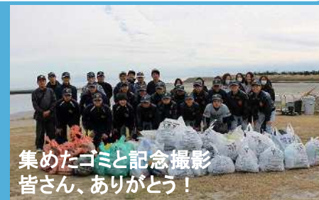
集めたゴミと記念撮影 皆さん、ありがとう！

御前崎中学校野球部は、奉仕の心を育て、地域に対する愛着と関心を深めることを目的として、令和5年11月26日(日)、部員と父兄含め総勢60名でマリパーク御前崎の海岸清掃を行いました。