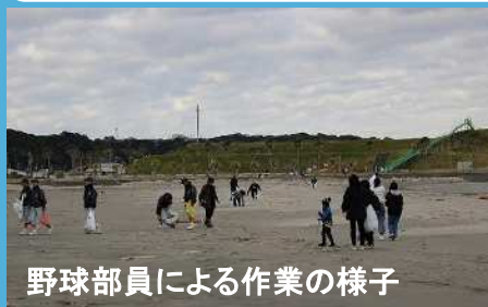
野球部員による作業の様子