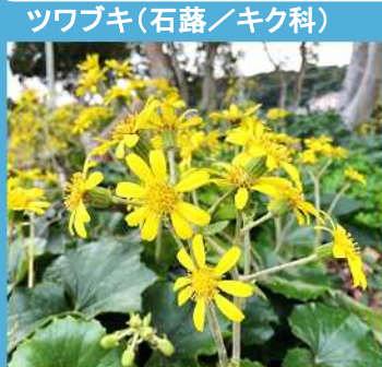
ツブキ(石蓼ノキク科)

海岸近くの岩場などに自生し、初冬に黄色い花を咲かせ、昔から民間薬や食用野草として広く知られております。