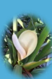
葉の根元に花が咲きます

静岡市清水区の草薙神社にエコパークのセロームの葉を奉納しました。参拝時に手や口を清める手水舎を花などで飾って「花手水」に仕上げられました。